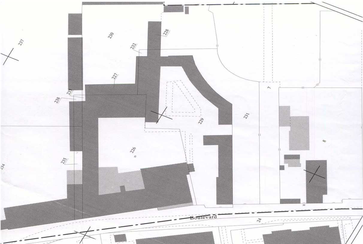
L'entrée du Parc de Petit-Bourg cadastre 2004